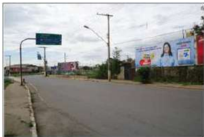
SETELAGOAS, AV. RENATO AZEVEDO COM ANDRÉ SUL, SENTIDO BARRIO - CENTRO.