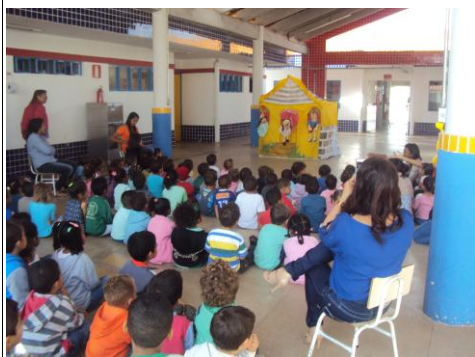
Atividade realizada na Escola Lucas Rodrigo em 10/07/2015