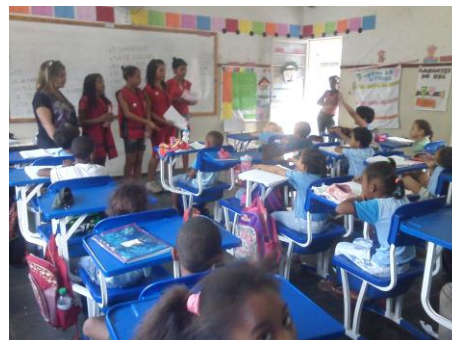
Brigada contra a Dengue na Escola Dalva Diniz no dia 09/07/2015