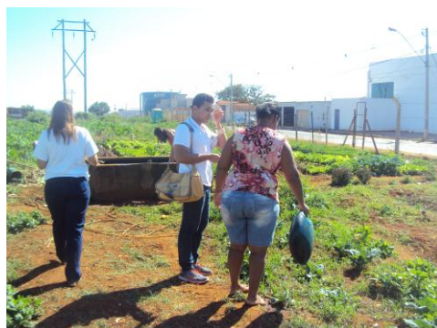
Mobilização social na Horta do Montreal 03/08/15