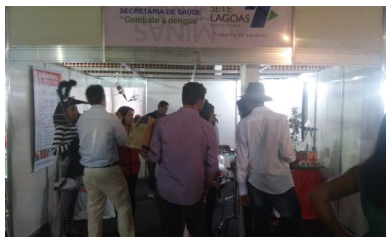
Stand Exposte 06 a 09/08/15