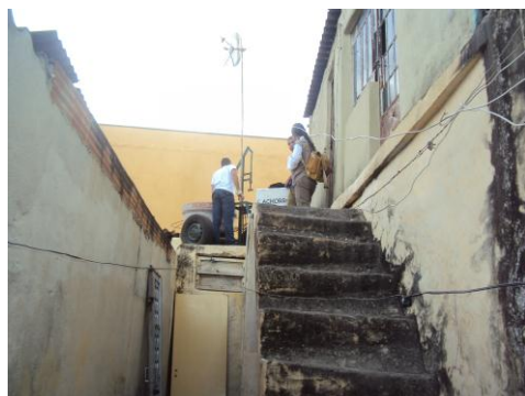
TPVE e Mobilização social na Várzea 14/08/15