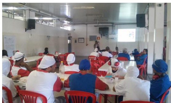
Palestra na Itambé 05/08/15

- Equipe de Agentes de Endemias continua fazendo mobilização através de palestras e teatro em escolas e unidades de saúde do município. Nos bairros em que teve alta infestação foi realizado "corpo a corpo" com a população para informar e mobilizar contra o mosquito.