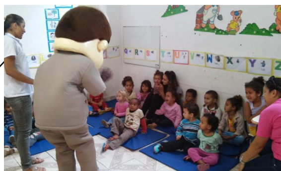
Associação Santa Terezinha Belo Vale 08/09/15