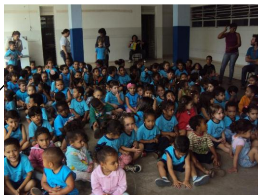
Escola Luzia Barbosa Boa Vista 28/08/15