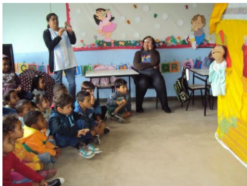
Projeto Pequeninno Belo Vale 09/09/15

- Equipe de Agentes de Endemias continua fazendo mobilização através de palestras e teatro em escolas e unidades de saúde do município. Nos bairros em que teve alta infestação foi realizado “corpo a corpo” com a população para informar e mobilizar contra o mosquito.