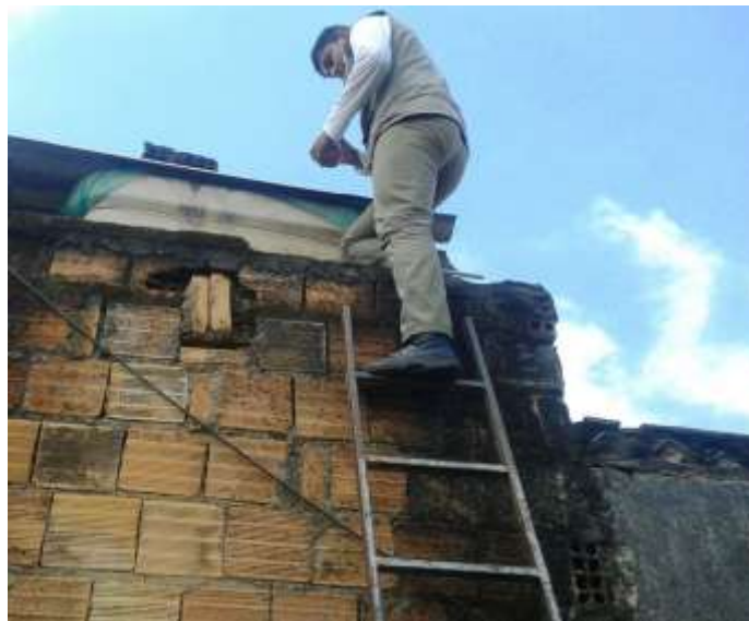
Tratamento Focal Sede - Visitas Realizadas - 2º ciclo / 2015

1.3-Tratamento Focal – Os Agentes de Endemias concluíram as visitas aos 110.000 imóveis de Sete Lagoas para execução do 2º ciclo de 2015. Foram visitados 79,6% dos imóveis no ciclo. O setor de estatística do controle da dengue já digitou as visitas do 2º ciclo, que foram inseridos no sistema nacional SISPNCd e estão apresentados de forma consolidada na tabela abaixo.