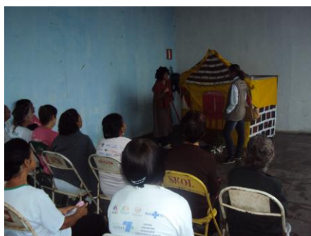
ESF Esperança 20/01/16