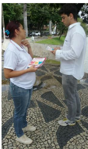
Lagoa Paulino 15/01/16

- Equipe de Agentes de Endemias continua fazendo mobilização através de palestras e teatro em escolas e unidades de saúde do município. Nos bairros em que teve alta infestação foi realizado "corpo a corpo" com a população para informar e mobilizar contra o mosquito.