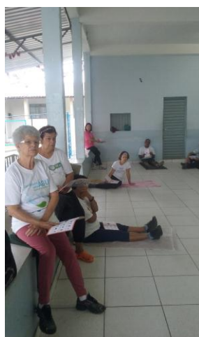
ESF Progresso 18/01/16