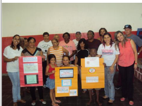
ESF Monte Carlo 28/01/16