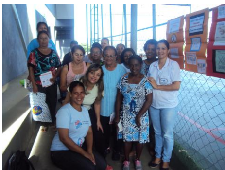
ESF Itapuã 26/01/16

- Equipe de Agentes de Endemias continua fazendo mobilização através de palestras e teatro em escolas e unidades de saúde do município. Nos bairros em que teve alta infestação foi realizado "corpo a corpo" com a população para informar e mobilizar contra o mosquito.