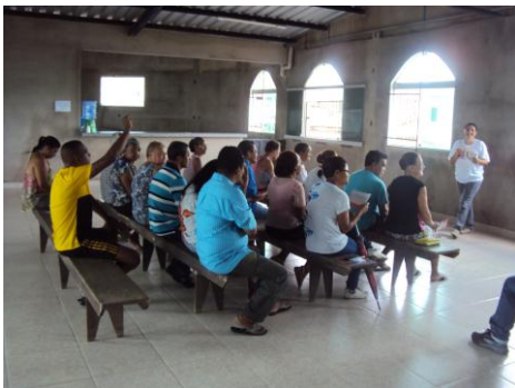
ESF São João 27/01/16