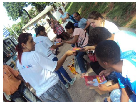
Blitz CAT JK 28/01/16