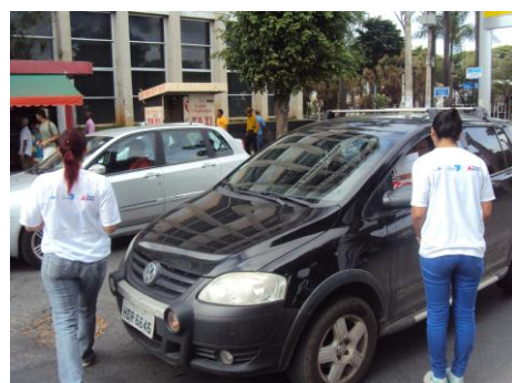
Blitz CAT JK 27/01/16