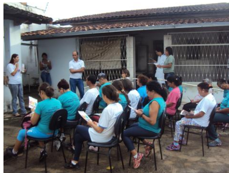
ESF Padre Teodoro 28/01/16