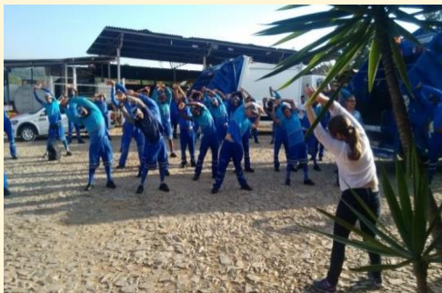
06/03/17: CEREST na Empresa VINA (SIPAT)