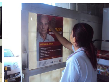
Monte Carlo 02/02/16