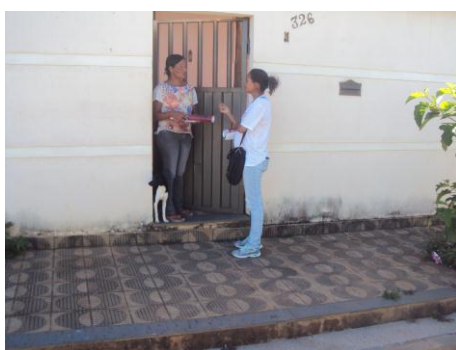
Cidade de Deus 01/02/16