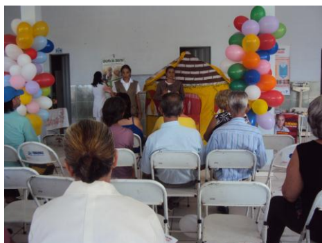
ESF Progresso 29/01/16