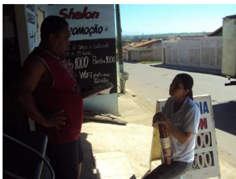
Associação Cidade Nova 02/02/16