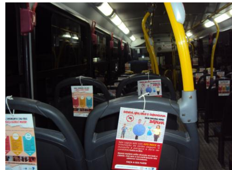
Turi Transportes 15, 16 18/02/16