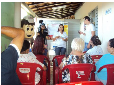
ESF Kwait 17/02/16