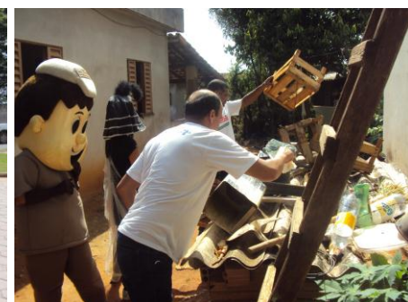
Mutirão de Limpeza e Mobilização 13/02/16