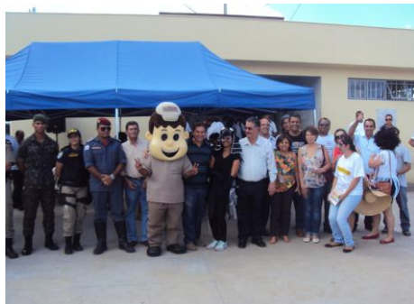
Estação Transbordo 05/02/16