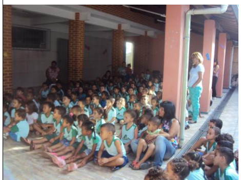
Creche Paulo Tarso 15/02/16