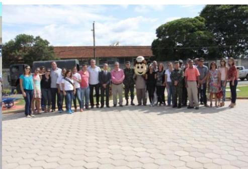
Mutirão de Limpeza e Mobilização 13/02/16