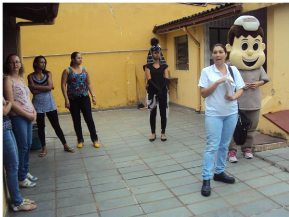
CRAS Centro 18/02/16