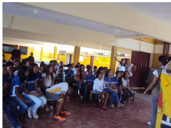
Escola Alonso MARque 15/02/16