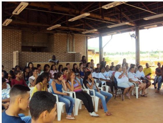
CRAS Cidade de Deus 19/02/16