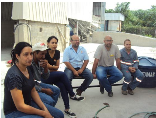
Empresa Geramix 23/02/16