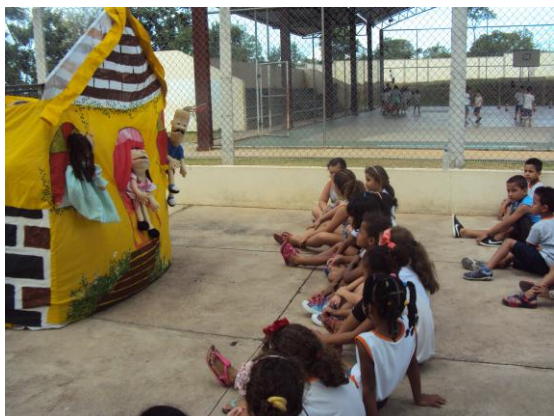
Escola Mauro Fácio Gonçalves 22/02/16