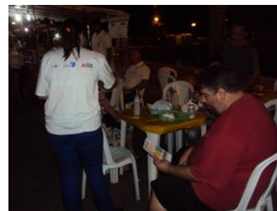
Escola Municipal Alípio Maciel – 29/02/16