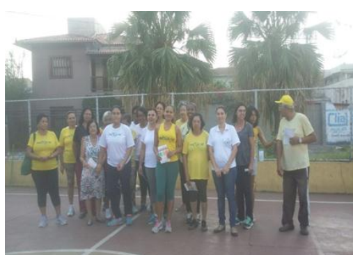
Lagoa Catarina 27/04/16