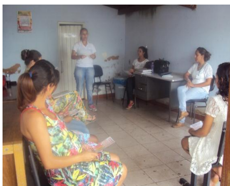
ESF Monte Carlo 26/04/16