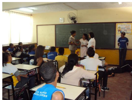
Escola Alonso Marques Manoá 07/10/15